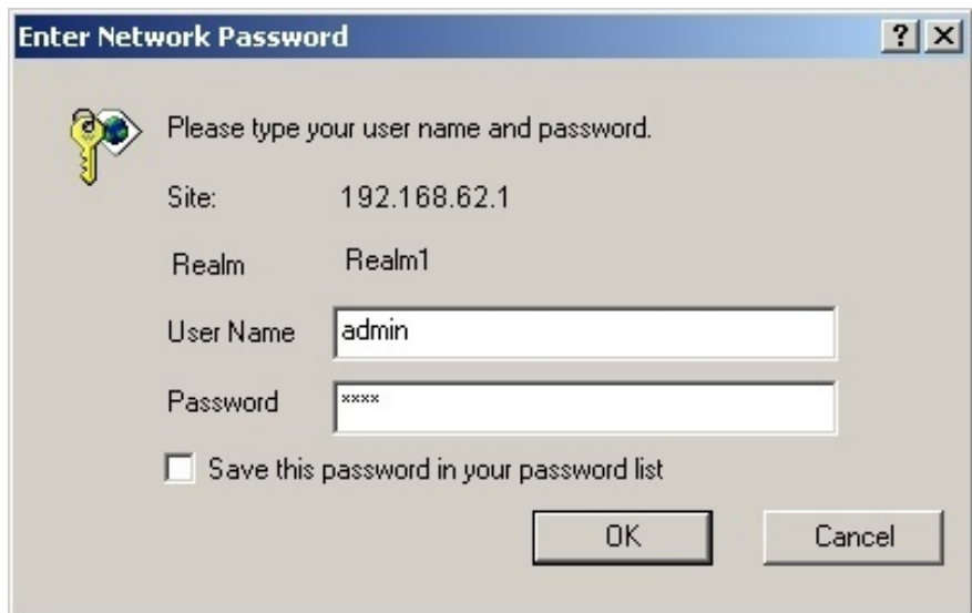
ABBILDUNG 1: Dialogfeld zur Anmeldung

9. Tippen Sie admin in das Eingabefeld 'User Name'.